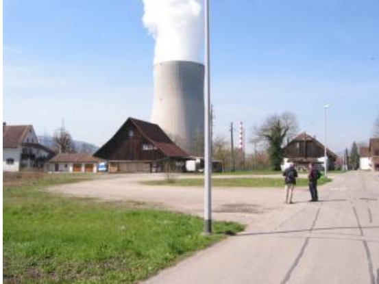
Lieu de la manifestation initiale