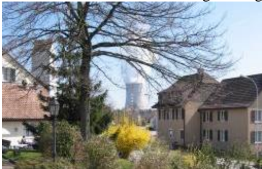
Place du village Obergösgen